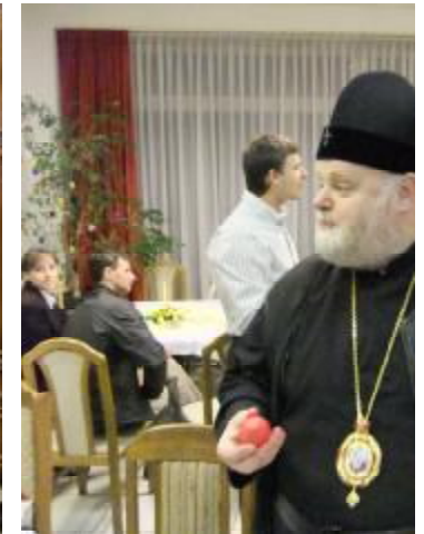
... і чим закусити