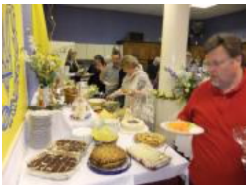
В буфеті – багатий вибір страв