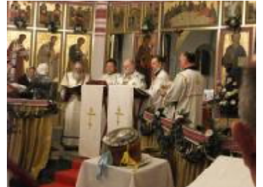
Євангеліє читається одночасно п'ятьма мовами