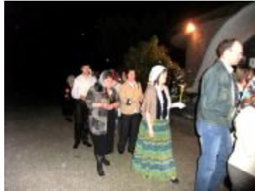
Хресна хода з запаленими свічками навколо храму