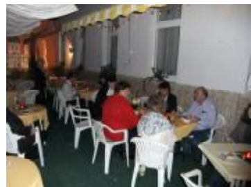
А на веранді – тепло, ніби влітку