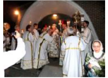
Перед входом у храм