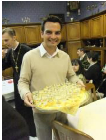
Кінець посту. Є і що випити,...