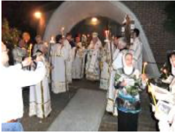
Перед входом у храм