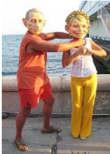
Проти Юлії Тимошенко відкрили

З початку року в нас пропадали: цукор, потім борошно і, накінець, гречка. І після кожної «пропажі» продукти з'являлися, але вже за вищими цінами. А на гречці партія Регіонів взагалі вирішила заробити скажені гроші – її закупили в Китаї аж 20 тисяч тонн. Коли перевести на гроші – це сотні мільйонів навару, причім, в приватну кишеню. А що таке китайська гречка? З цим питанням журналісти звернулись до шеф-повара одного з китайських ресторанів Києва: а які блюда ви готуєте з гречки? Китаєць дуже здивувався і відповів, що китайці гречки не їдять, вони їдять лише рис. А гречку китайці вирощують? Да, щоб готувати свиней. І ось 20 тисяч тонн цієї «свинячої» гречки незабаром поставлять на Україну. Але ж українці не дурні, продавці зразу ж цю гречку виставлять як нашу, рідну, а покупці теж не зовсім дурні і перестануть купляти і китайську гречку, і нашу рідну теж. Бо перейдуть на рис – він поки-що дешевший. А наша гречана промисловість захиріє, бо комусь з партії Регіонів закортіло заробити на чужій біді декілька сот мільйонів гривень.